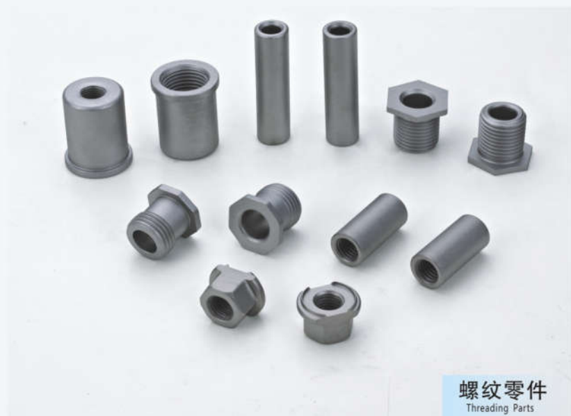
螺纹零件 Threading Parts