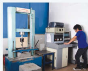
万能拉力试验机 Tensile testing machine