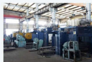
拉丝 Wire drawing