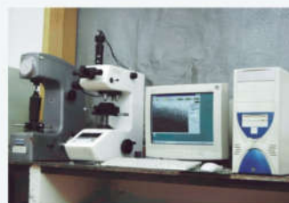
金相显微硬度机 Metallographic Microscope