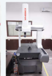
三坐标测量仪 Coordinates Measuring Machine