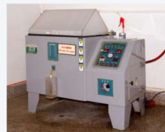
盐雾试验机 Neutral salt spray Testing Machine