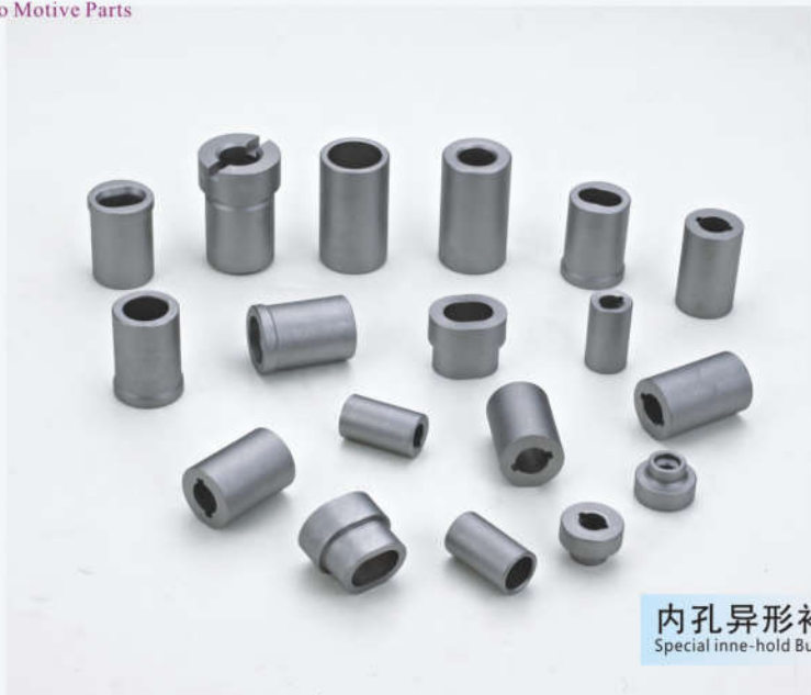
内孔异形衬套 Special inne-hold Bushings