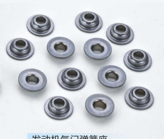
发动机气门弹簧座 Valve spring retainer