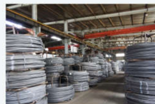
原材料 Raw material