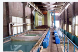
线材磷化 Phosphating of wire rod