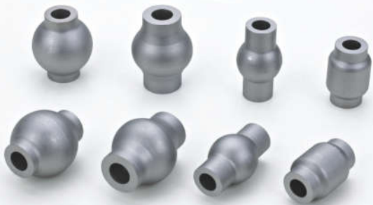
减震器葫芦衬套 Special Bushings for absorber