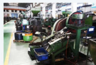
辗牙 Grinding teeth