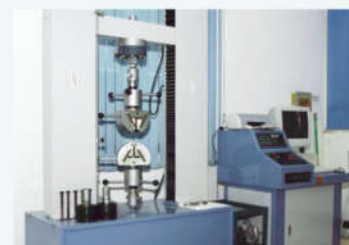
电脑式万能材料试验机 Universal material testing machine for computer room