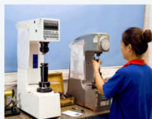
洛氏硬度机 Hardness Testing Machine