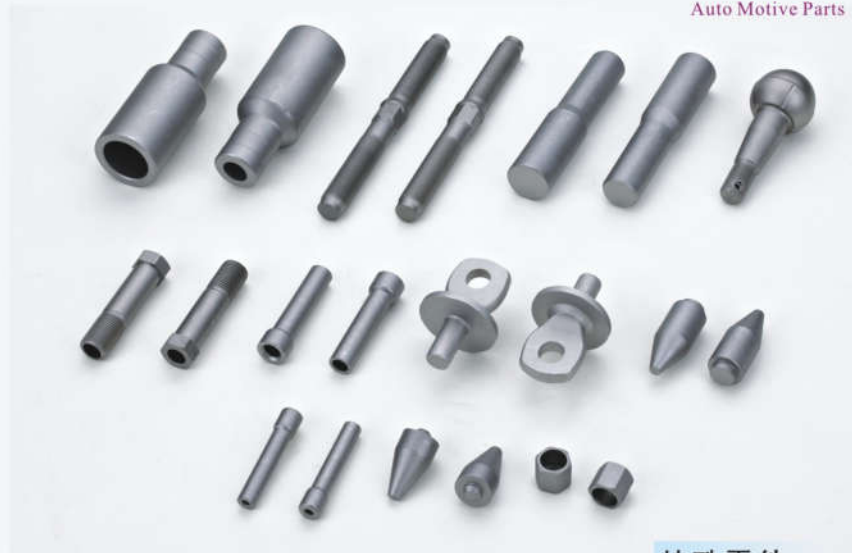
特殊零件 Special Parts