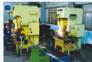
多工位冲床 Multi station punch press