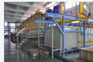
全自动吊挂式镀铬车间 Fully automatic hanging chrome plating workshop