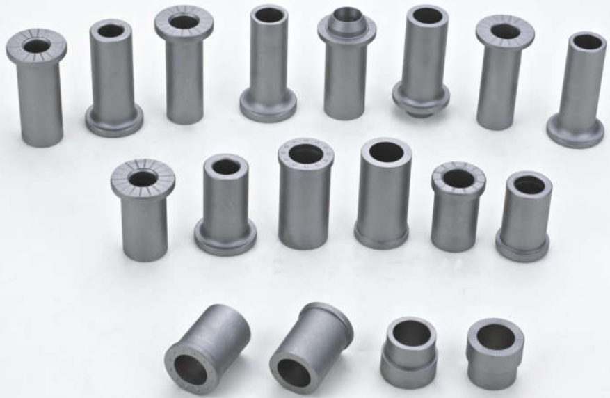
带点带齿衬套 Weld bushing