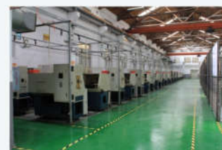
CNC数控 CNC numerical control