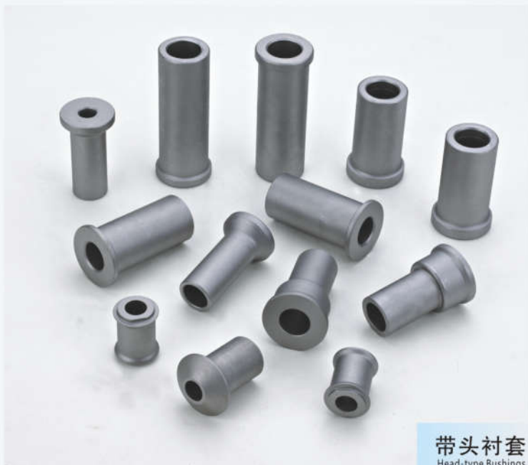
带头衬套 Head-type Bushings