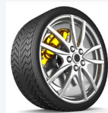
轮胎螺帽 Wheel nut