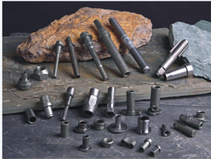
According to customer's drawing