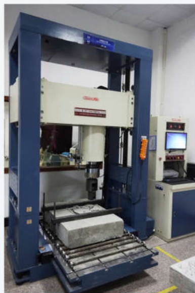
50吨拉力试验机 50 tons tensile testing machine