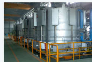
美国进口钟罩式球化退火炉 Bell bell type spheroidizing annealing furnace imported from USA