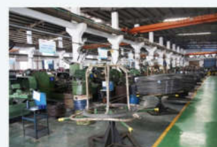
打头 Hit the head