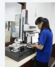
3D轮廓仪 3D profilometer