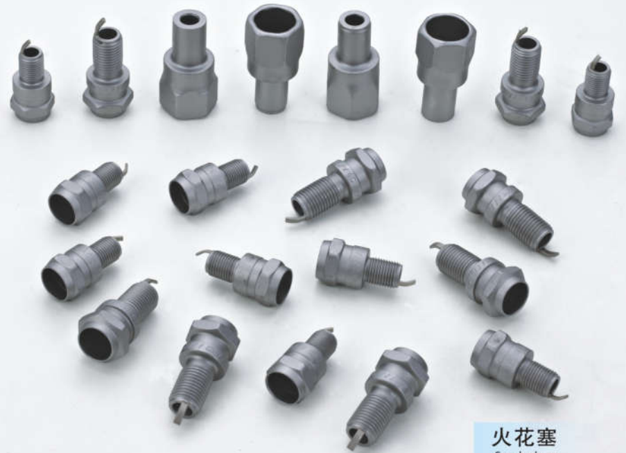
火花塞 Spark plugs