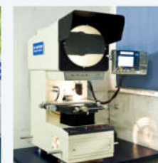
数字式投影仪 Digital projector