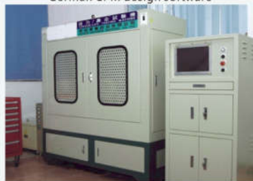
电脑式万能扭力测试机 Torque Testing Machine