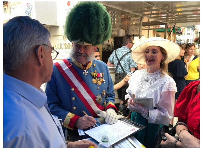
Das Bild zeigt den „Kaiser und seine Elisabeth“ beim Unterzeichnen der Unterstützungserklärung

sekretaer@skglb.org oder per Brief an unsere Vereinsanschrift (siehe Impressum).