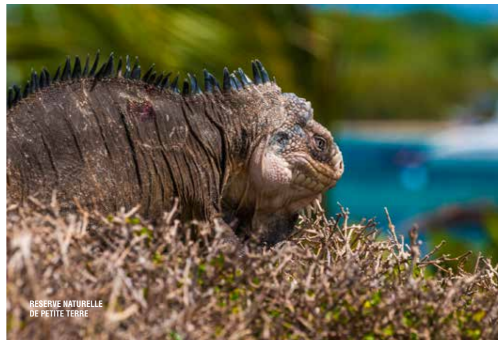
RÉSERVE NATURELLE DE PETITE TERRE