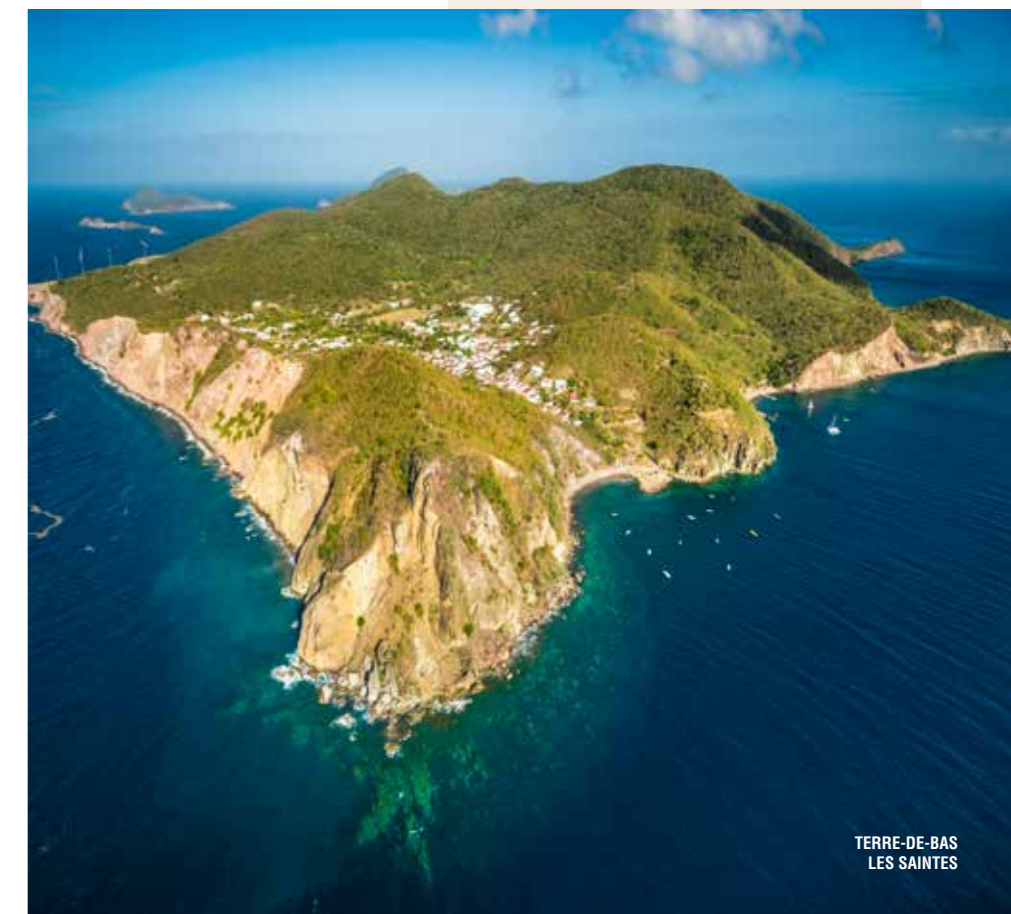
TERRE-DE-BAS LES SAINTES