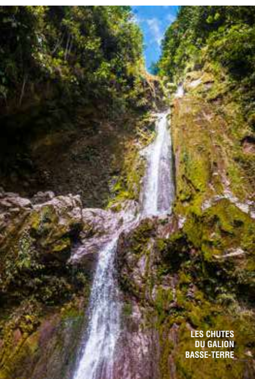
LES CHUTES DU GALION BASSE-TERRÉ