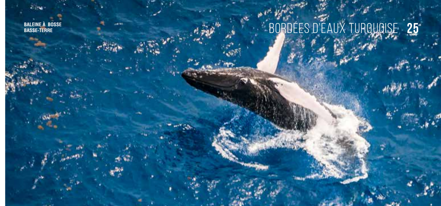
BALEINE À BOSSE BASSE-TERRE

Seconde plus grande aire marine protégée de l'outre-mer, le sanctuaire AGOA accueille une trentaine d'espèces de cétacés. On peut ainsi y rencontrer des dauphins, des cachalots, des globicéphales et les célèbres baleines à bosse. Ces dernières viennent profiter des eaux chaudes des îles de Guadeloupe pour se reproduire et mettre bas de décembre à mai, offrant pour l'occasion de superbes spectacles lors des parades nuptiales ! Et afin de respecter le terrain de jeu de ces mammifères marins, les prestataires touristiques de l'archipel ont été formés à des règles d'approche permettant l'observation des animaux sans dérangement.