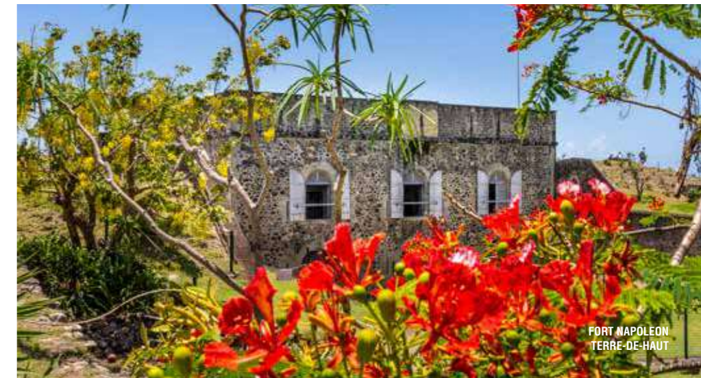
FORT NAPOLEON TERRE-DE-HAUT

se rappeler Les Saintes de son enfance quand la pêche, alors abondante, nourrissait l'île et ses habitants. Il se prend à rêver parfois à un retour aux origines, à des canots poussés par la seule force du vent et à une pêche plus durable.