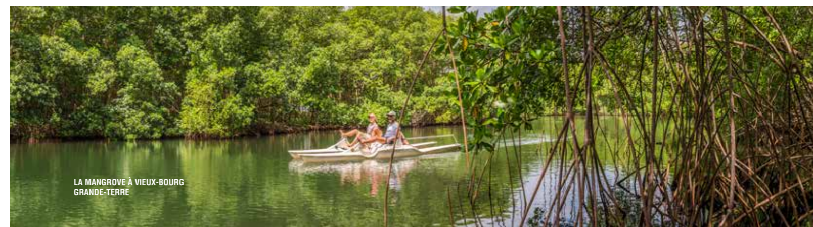
LA MANGROVE À VIEUX-BOURG GRANDE-TERRE

des centaines de sternes qui viennent nidifier dans son sable blanc. Quel que soit le site choisi pour une journée d'évasion, ces îlets comme tous les espaces naturels de l'archipel sont précieux et fragiles. Ils sont donc à visiter en douceur, dans le respect de la faune et de la flore présentes.