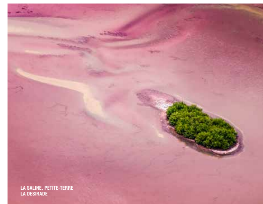
LA SALINE, PETITE-TERRE LA DESIRADE

À Petite-Terre, dans le cœur marin des îlets Pigeon, dans le Grand Cul-de-Sac Marin, d'autres réserves naturelles offrent d'inoubliables expériences aux visiteurs. Interdites à la pêche, réservées pour certaines, à des prestataires choisis pour leur connaissance de l'environnement et respectueux de la vie animale, elles permettent une immersion au plus près de nombreuses espèces. Ainsi, il n'est pas rare de pouvoir nager avec les tortues marines sur les plages de Malendure, le long de la barrière de corail du Grand Cul-de-Sac Marin (la plus longue des Antilles) ou dans le lagon préservé de Petite-Terre. Mais ces sites abritent également de beaux spécimens de poissons et en plongée comme en randonnée sous-marine, il est fréquent de croiser des mérous, des perroquets, des balistes, des diodons ou des raies.