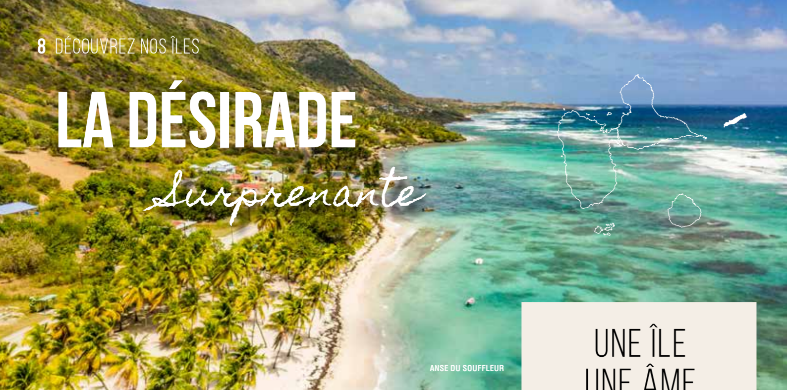
ANSE DU SOUFFLEUR