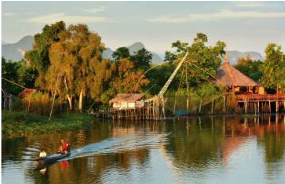
| La rivière de Klong Pak Pra