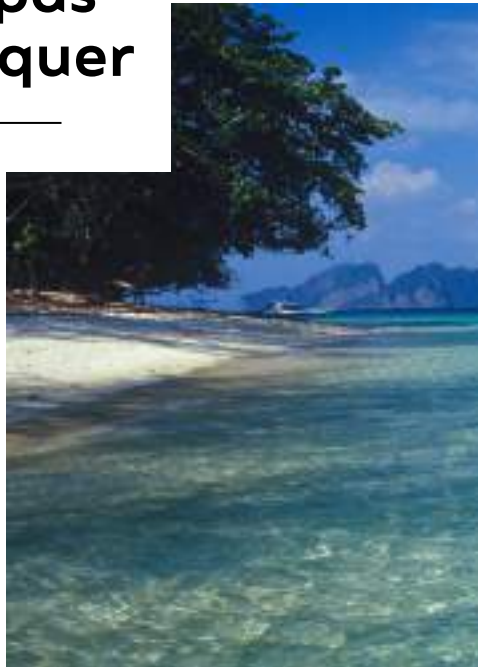
| Le Parc National Hat Chao Mai