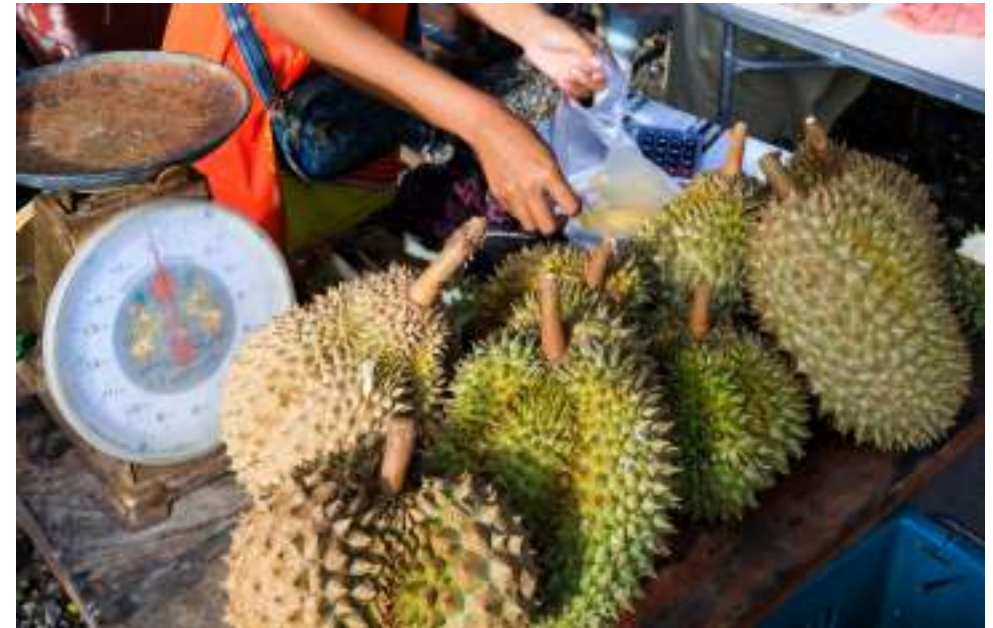
| Des durians de Ban Khiri Wong

Le dimanche, de 14h à 21h, le marché de nuit, installé le long du canal Bang Chalak jusqu'à la rivière Pak Panang, est un endroit sympa pour dîner de mets locaux au bord de l'eau. On peut y dénicher de nombreux objets vintage et y déguster des spécialités culinaires d'antan, proposés par des vendeurs en habit traditionnel.