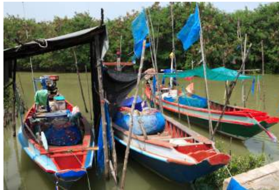
| Le village de pêcheurs de Laem Ta Lumpuk

Peu touristique, l'endroit compte de longues plages de sable bordées de pins et de filaos. Au village de pêcheurs, il est possible de se restaurer à bon prix avec des poissons et des fruits de mer de première fraîcheur.