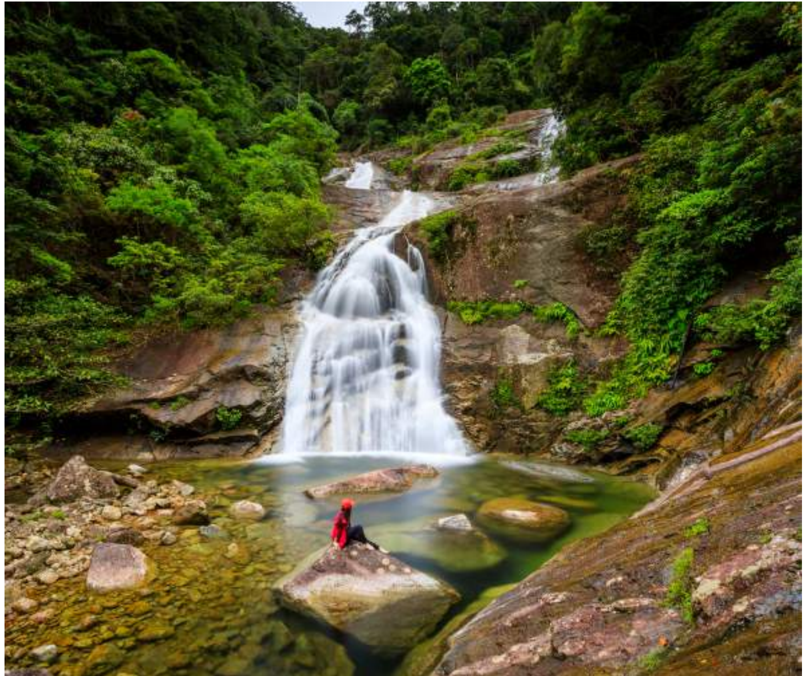
| Le Parc national de Khao Luang

Irrigué par une quinzaine de rivières, le parc de Khao Luang mérite le détour pour ses chutes d'eau, comme celles de Karom (19 niveaux), de Phrom Lok (50 niveaux et piscines naturelles) et de Krung Ching, qui fait 100 mètres de haut !