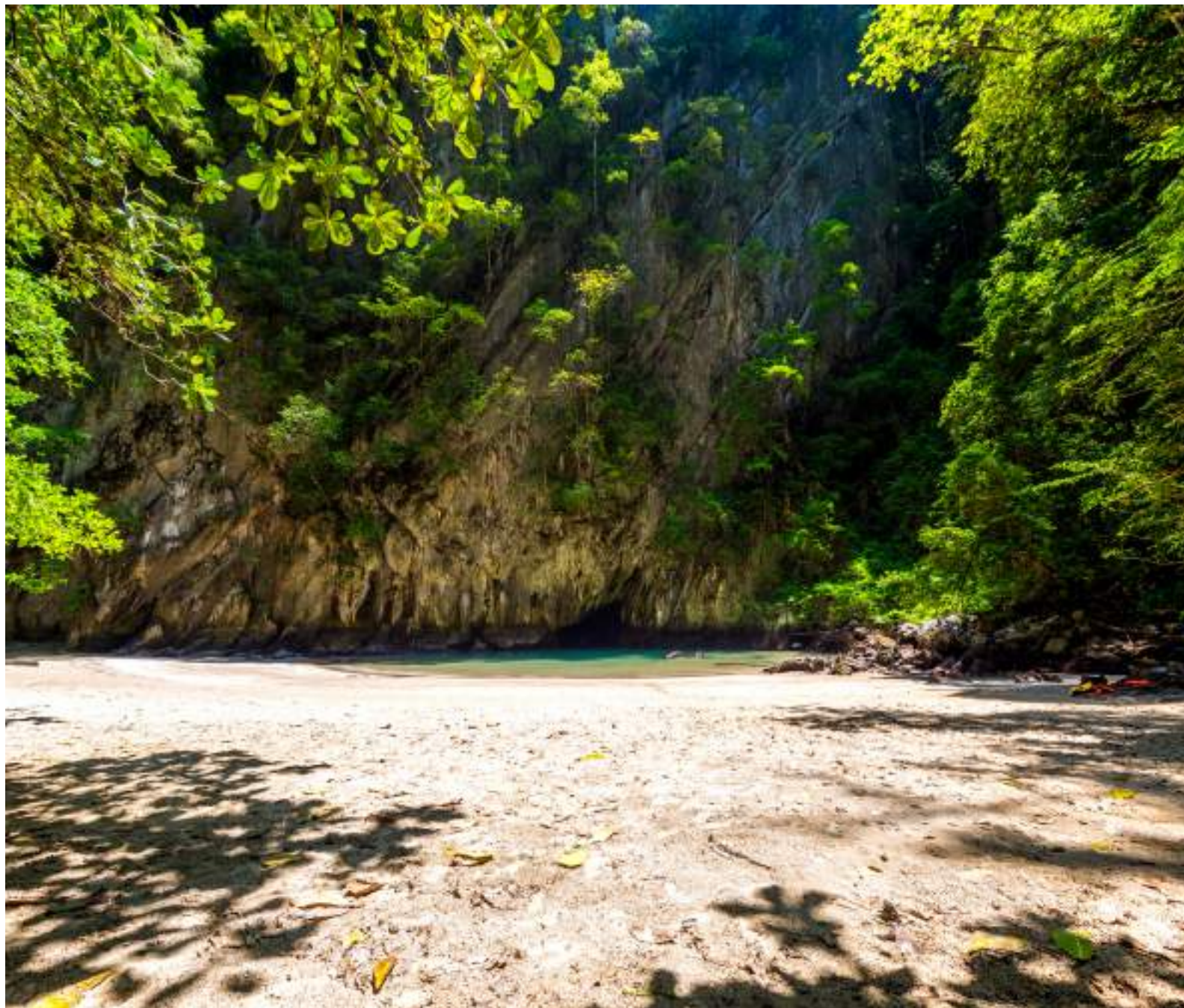
| La grotte d'Émeraude (Tham Morakhot)

Bordée à l'ouest par d'imposantes falaises où nichent les hironnelles et largement recouverte de jungle, Ko Muk compte deux superbes plages : Hat Sivalai à l'est du village et Hat Farang, lovée entre deux falaises sur la côte ouest, où les couchers de soleil sont splendides. Ko Muk est accessible en bateau depuis l'embarcadère de Kuan Thung Ku (40 mn).