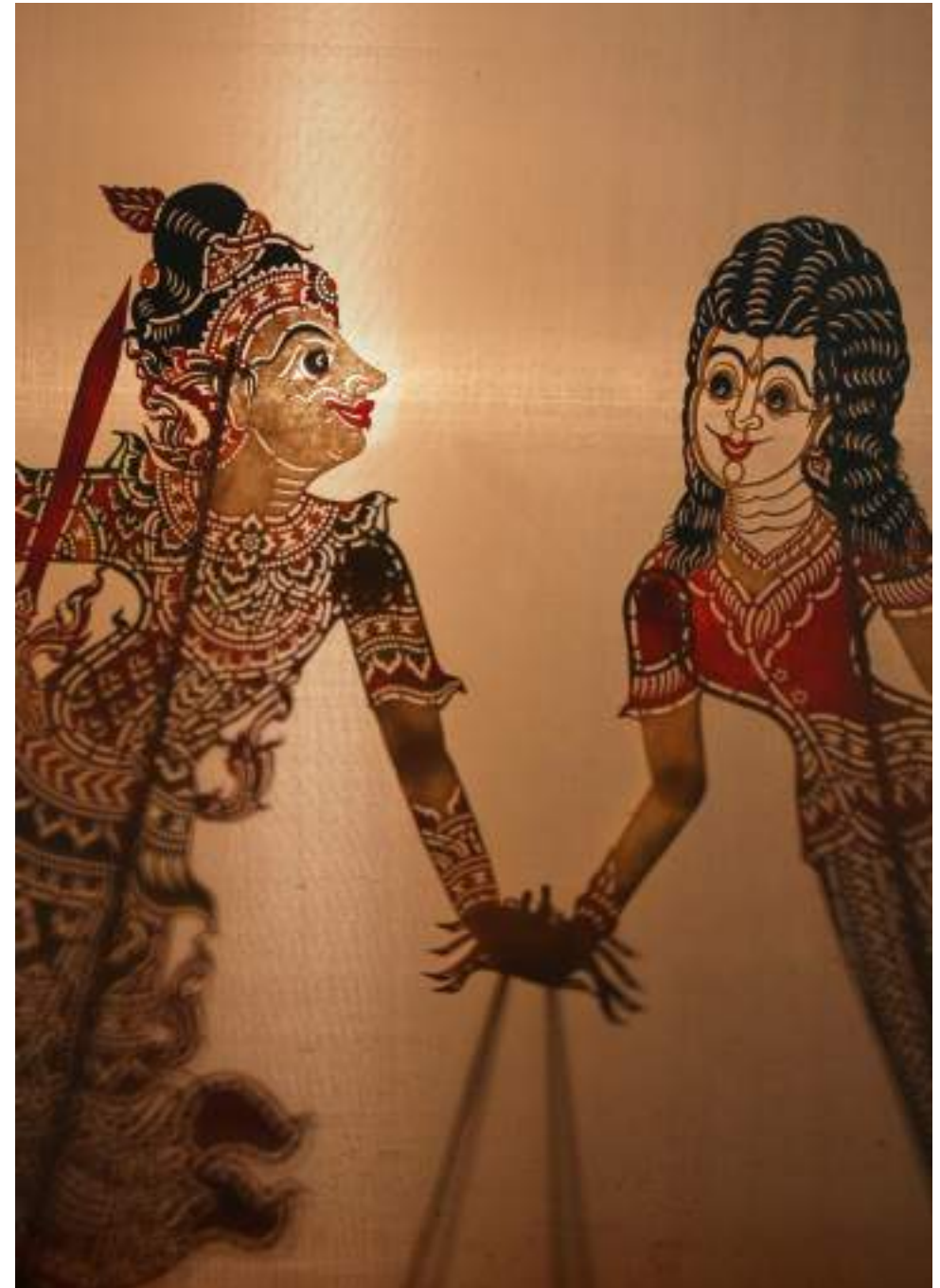
| Les marionnettes de Nung Talung