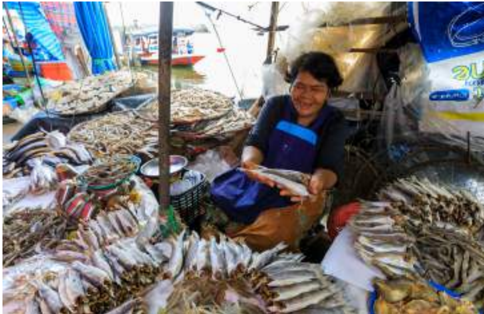
| Le marché de jour de Pak Panang