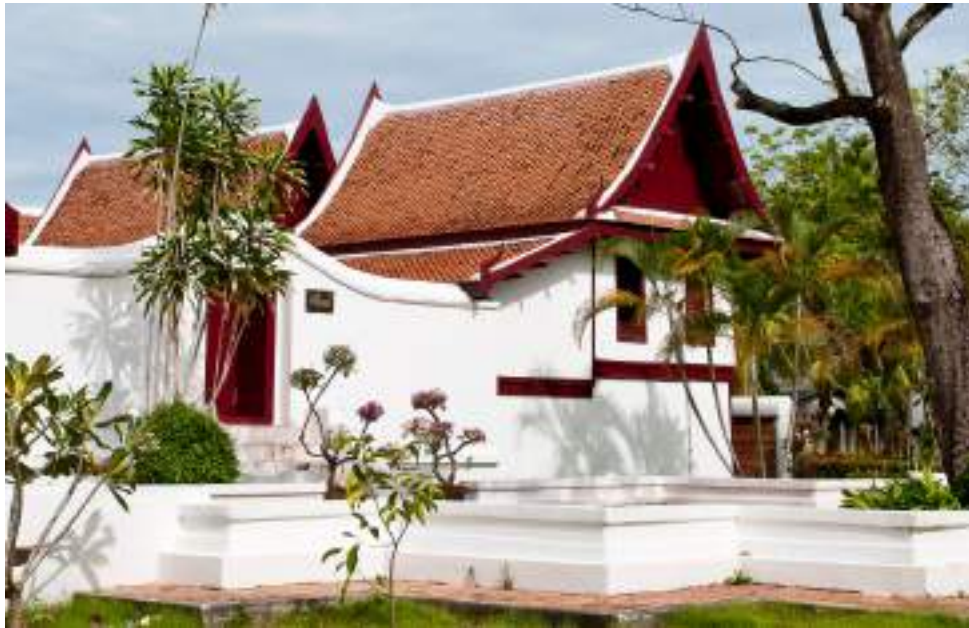
| La résidence du gouverneur de Phatthalung