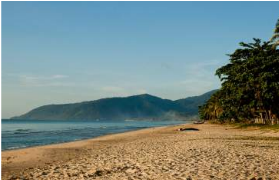
| La plage de Hat Khanom