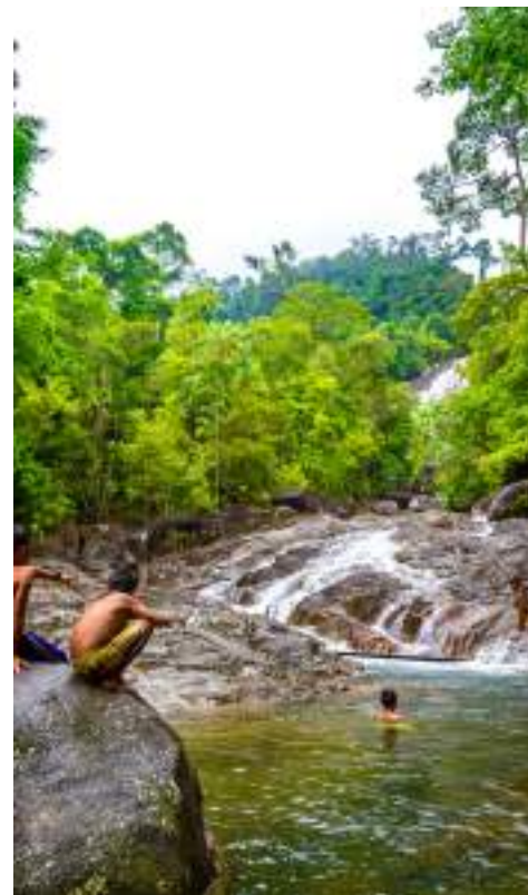
| La cascade de Phraiwan

Facile d'accès, on la rejoint en voiture en 1h de route environ ou par mini-bus au départ de la ville de Phatthalung. Dans les environs, d'autres chutes sont également à voir, comme celles de Manorah, Lan Mom Chui, Pak Rang, Lad Toey, etc.