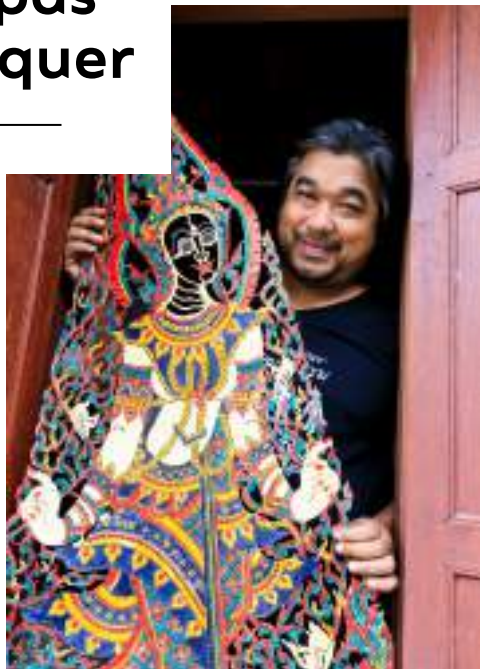
La plage de Hat Khanom • Le parc national de Khao Luang • Le temple Wat Phra Mahathat • La fabrication des marionnettes de Nung Talung