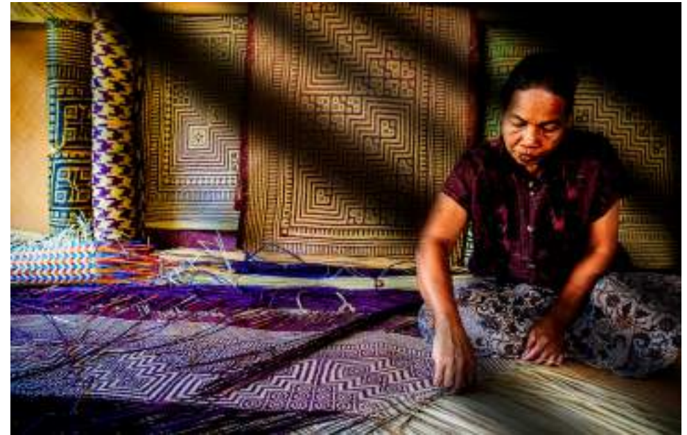
| La Coopérative Varni

Pour apprécier pleinement ces paysages et moments magiques, il faut partir en long-tail boat dès 5h30 du matin et assister au lever du jour sur les étendues d'eau. On peut ensuite poursuivre la balade en bateau plus loin dans le lac. Par moments, on aperçoit des rizières et des arbres dans l'eau. Une balade aquatique privilégiée.