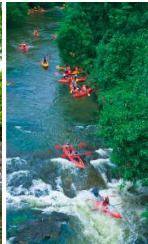
| Le rafting en canoë, rivière de Huay Nam Sai