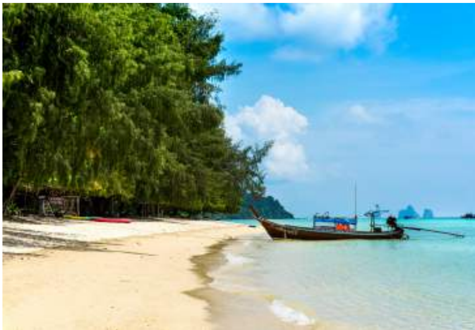
| L'île de Ko Kradan