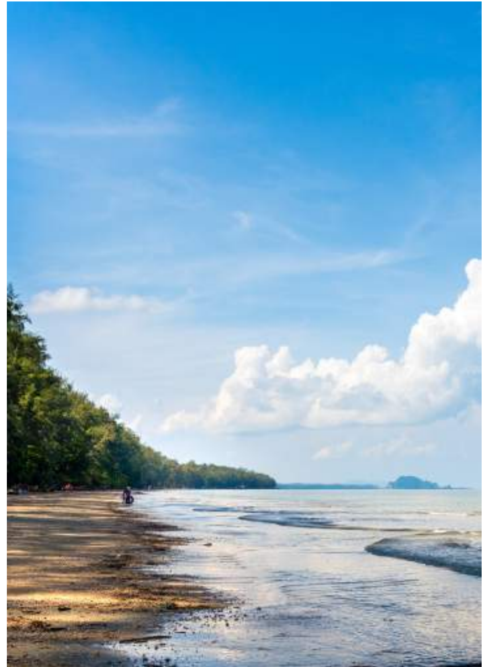
| Le Parc National Hat Chao Mai