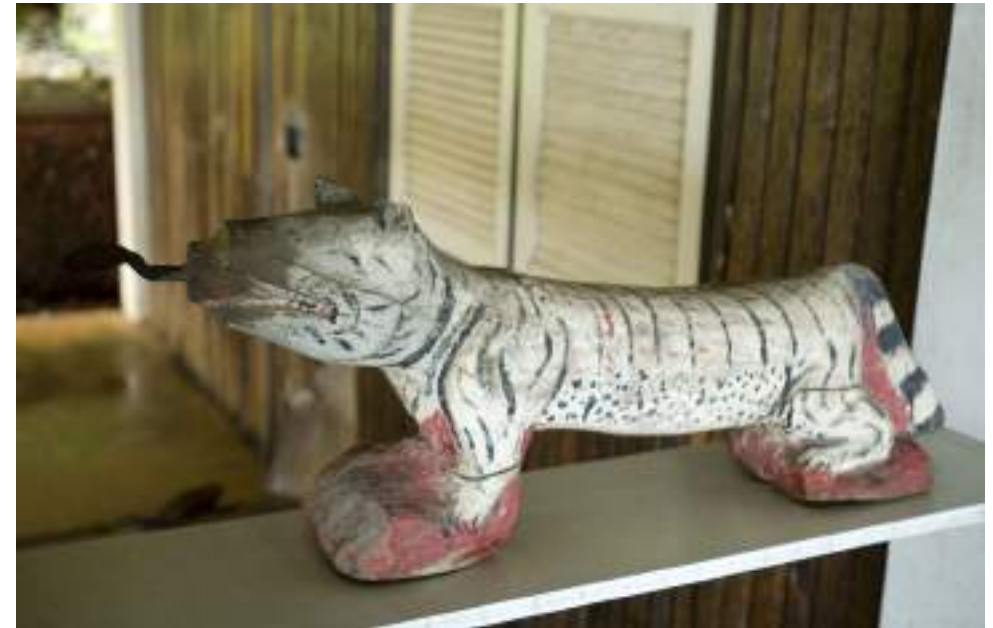
| Le musée du Folklore de Ko Yo

Non loin de là, la plage familiale de Hat Chalatat est propice à la baignade et au repos. Pour la plage encore plus tranquille et sauvage de Hat Maharat, il faut en revanche prendre la voiture et se rendre à une cinquantaine de km au nord près de la ville de Sathing Phra. Sable immaculé, eaux claires et ombre rafraîchissante des pins, Hat Maharat est un petit paradis.