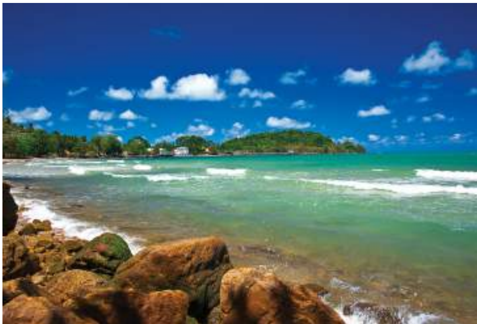
| La plage de Hat Hin Ngam