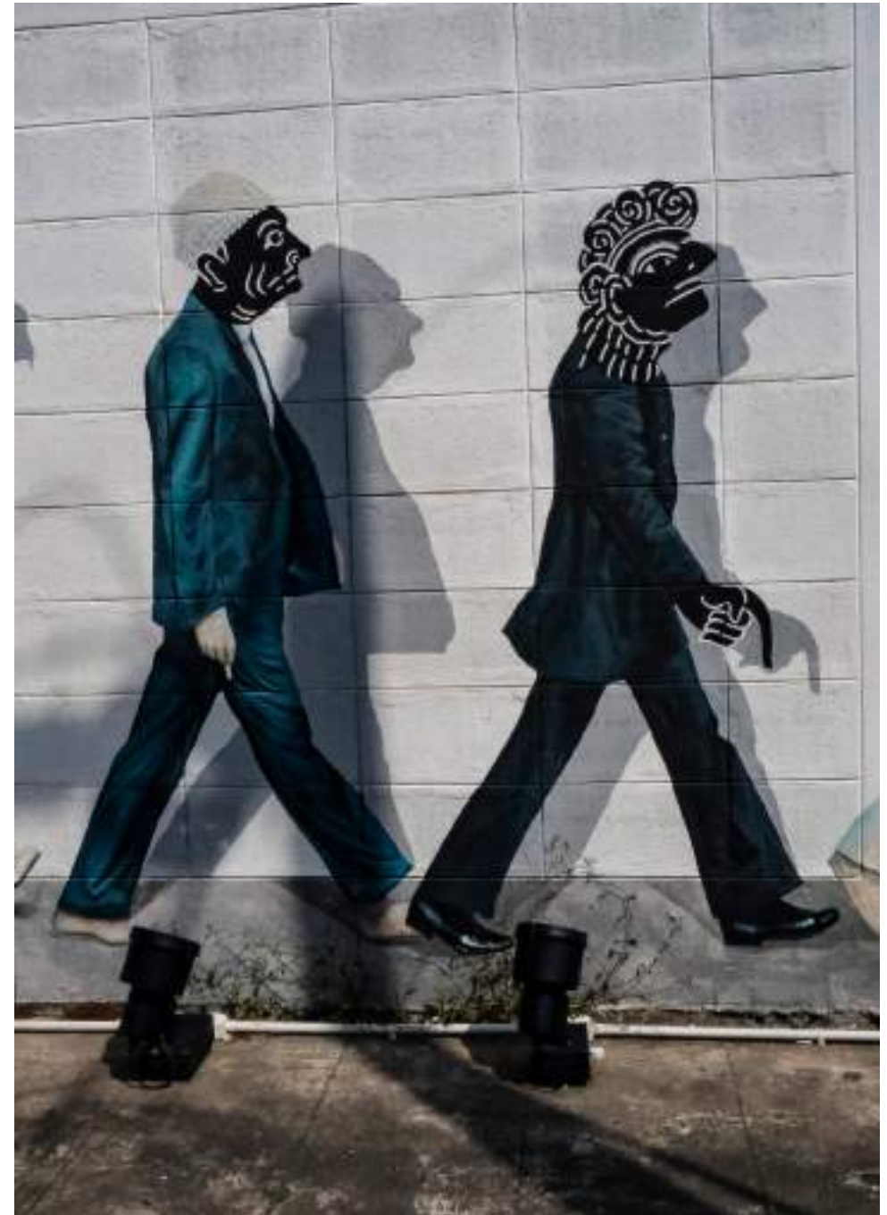
| Le street art de Hat Yai

En train : tous les jours au départ de la gare Hualamphong de Bangkok, via Hua Hin, Chumphon et Surat Thani (environ 17h de trajet).