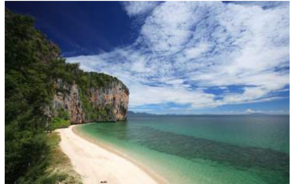
| L'île de Ko Lao Liang

Ko Libong est accessible en bateau depuis l'embarcadère de Ban Hat Yao (30 mn).