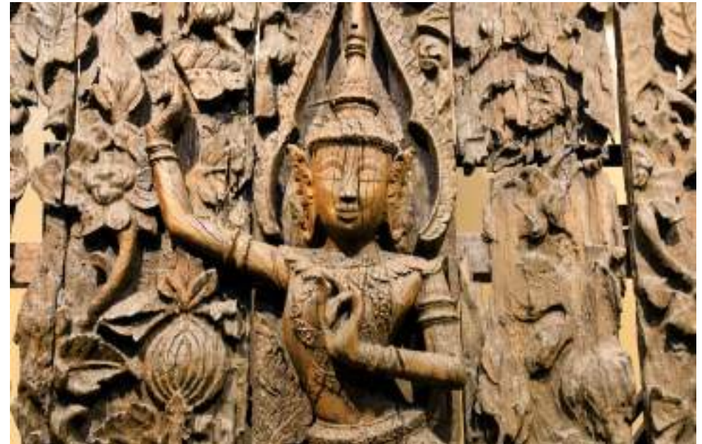
| Le Nakhon Si Thammarat National Museum

Hat Khanom est réputée pour ses fameux dauphins roses, que l'on peut aller observer au large lors d'excursions organisées.