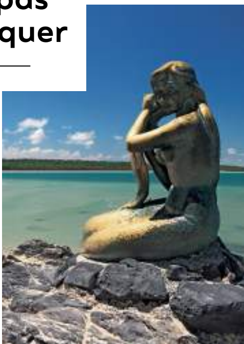
La ville de Hat Yai • Les œuvres de street art de la vieille ville de Songkhla • Le Songkhla National Museum • La statue de la sirène de la plage de Hat Samila