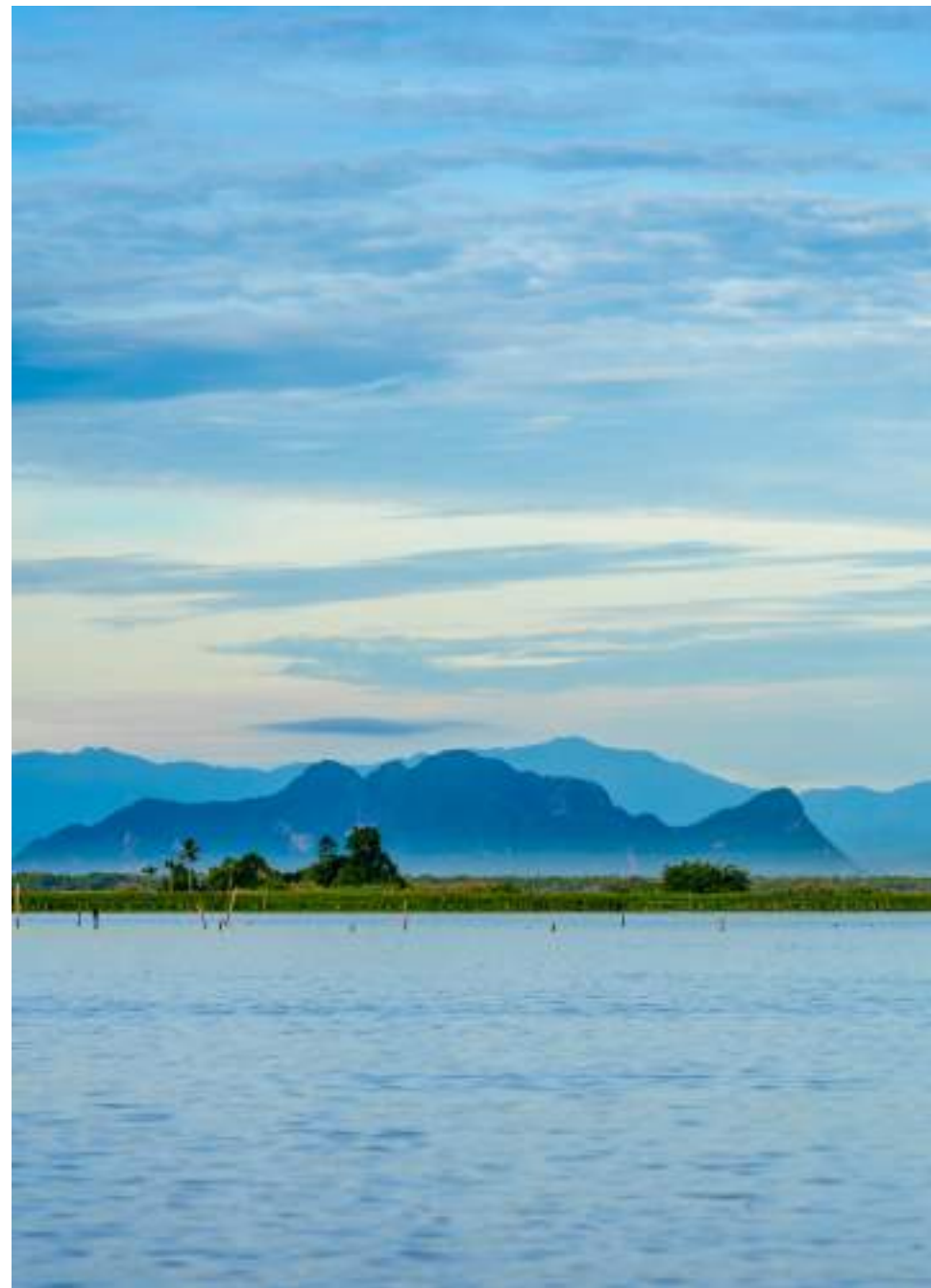
| La réserve de Thale Noi

Pour parcourir la province, il faut louer une voiture ou un taxi à la journée.