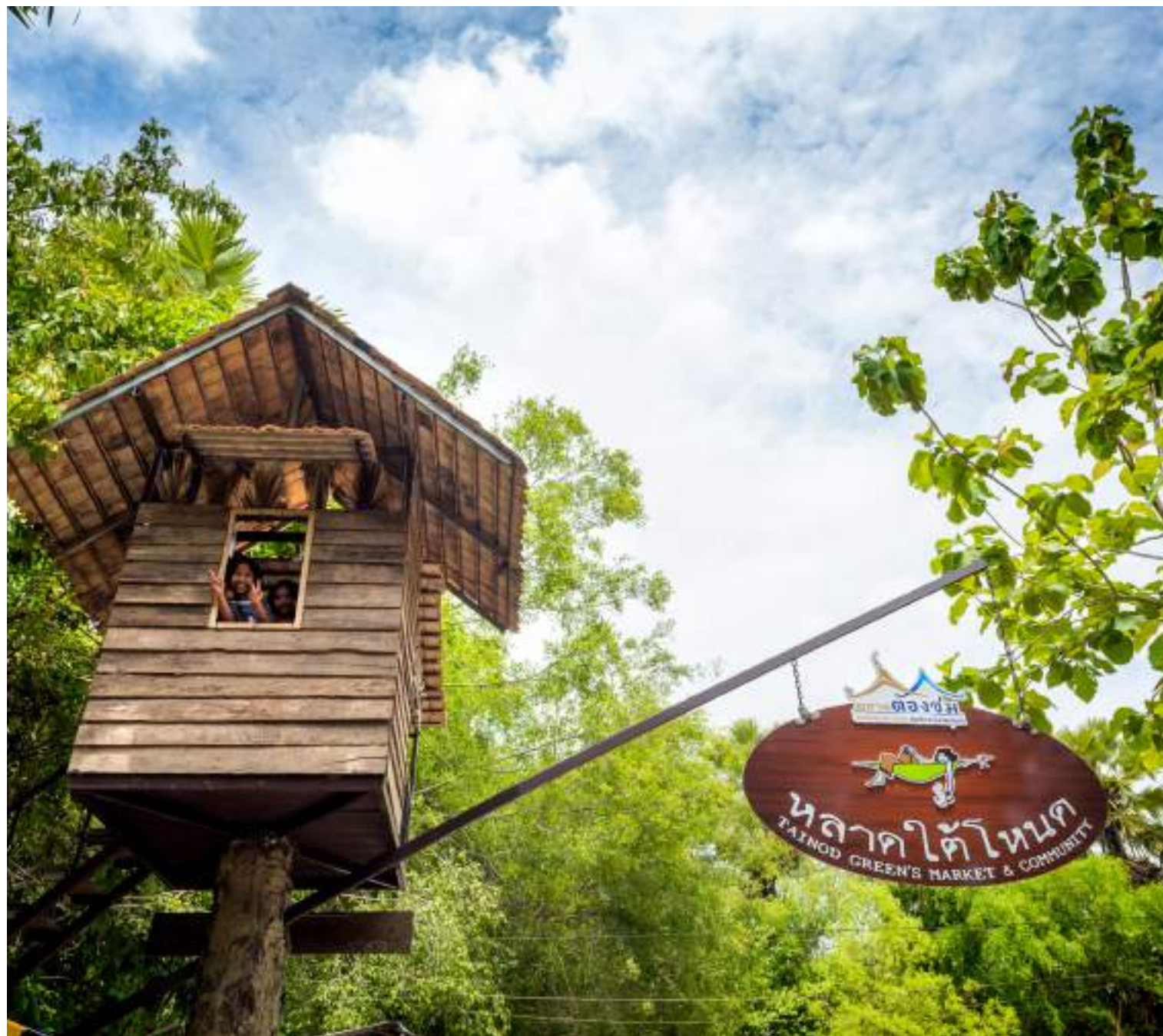
| L'entrée du marché aux puces de Talad Tai Nod

Lui aussi très couru, le marché de nuit de Phatthalung a lieu chaque soir de 15h à 22h30 à proximité de la gare. Le bon endroit pour découvrir la délicieuse cuisine de rue locale (qui peut parfois surprendre) et goûter au roti, une grosse crêpe qui se déguste souvent accompagnée de lait concentré sucré.