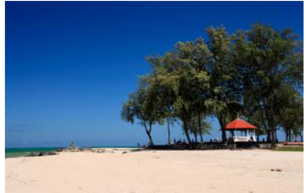
| La plage de Hat Samila et sa statue de sirène

Chaque année en octobre se déroule le Tak Bat Thevo, une cérémonie religieuse au cours de laquelle le chedi est entouré d'un long tissu et les moines reçoivent des offrandes de la population au pied de la montagne Khao Tang Kuan.