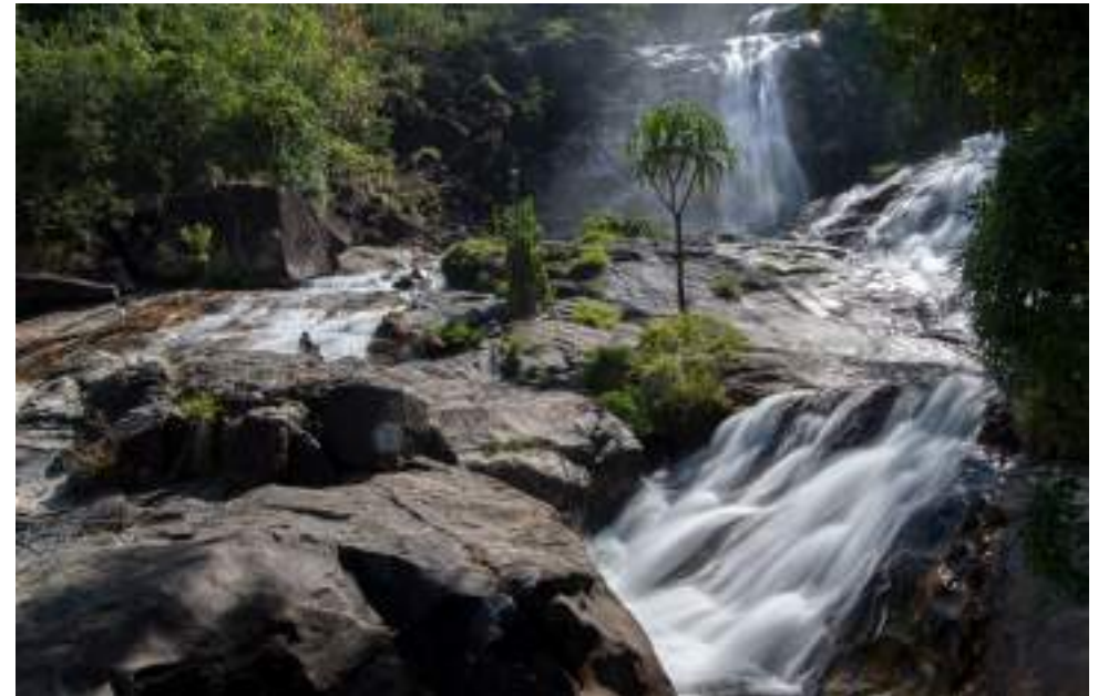
| Les chutes de Ton Nga Chang

Hat Yai est également connue pour le temple Wat Hat Yai Nai, qui abrite une reproduction du Bouddha couché longue de 35 m et haute de 15 m, ainsi que pour ses spectacles de combats de taureaux organisés tous les mois aux arènes de Nurn Khum Tong.