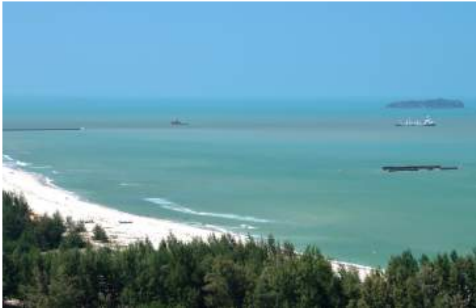
| Vue depuis la montagne de Khao Tang Kuan