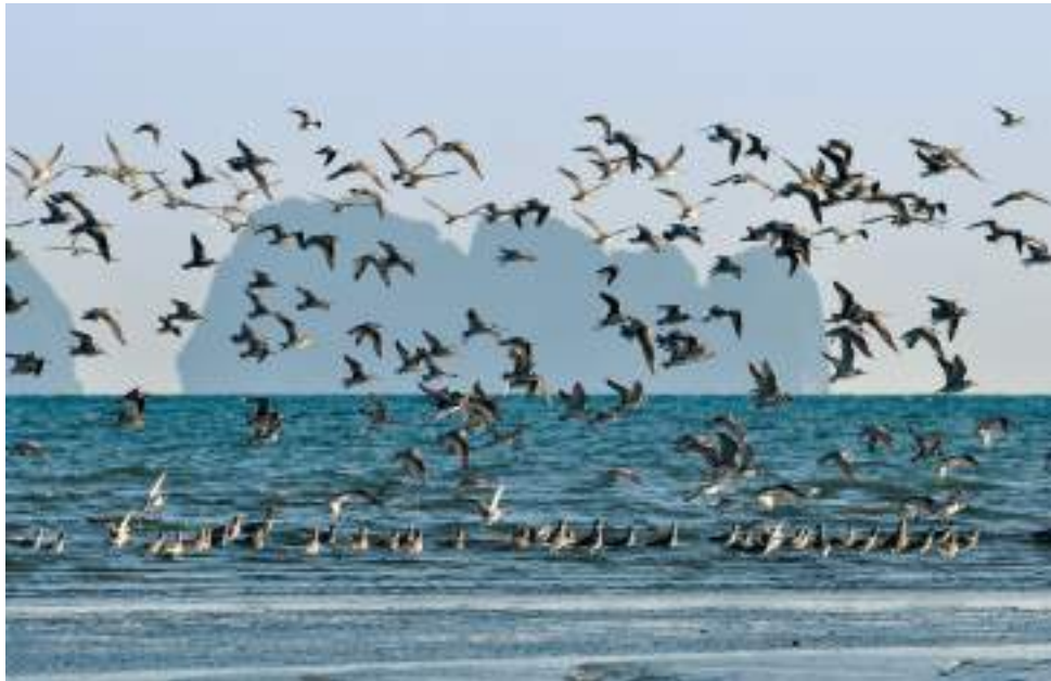
| L'île de Ko Libong