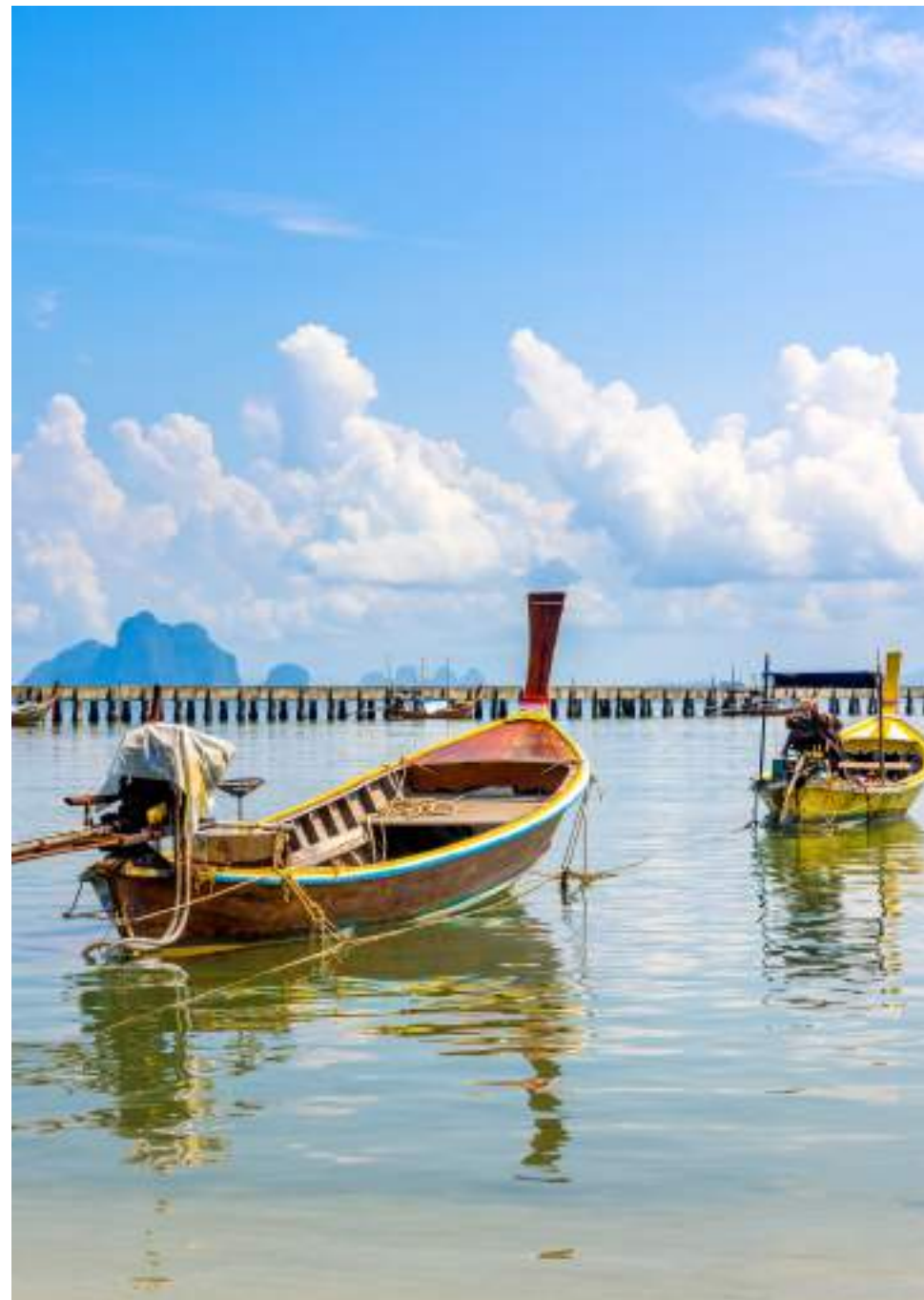
| Le village de pêcheurs de Ko Muk

En train : tous les jours au départ de la gare Hua Lamphong de Bangkok, via Surat Thani et Chumphon (environ 15h de trajet).