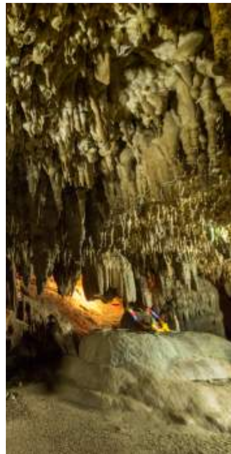
| La grotte de Tam Le Khao Kop

Ko Rok est accessible en bateau depuis l'embarcadère de Kuan Tung Ku (2h).