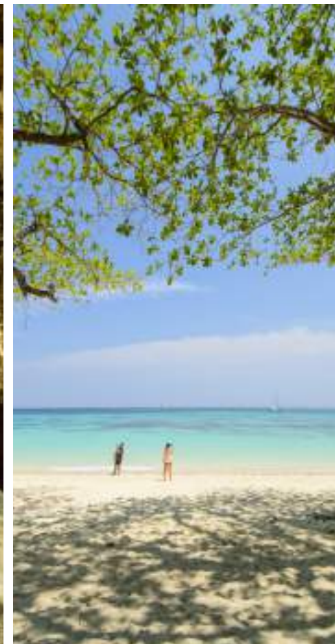
| L'île de Ko Rok