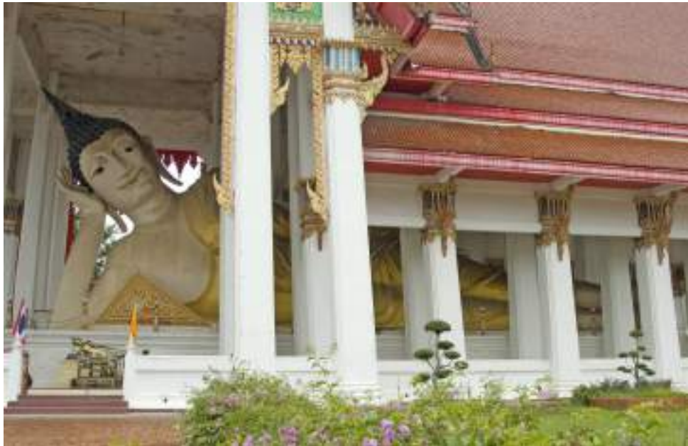
| Le Bouddha couché du temple Wat Hat Yai Nai