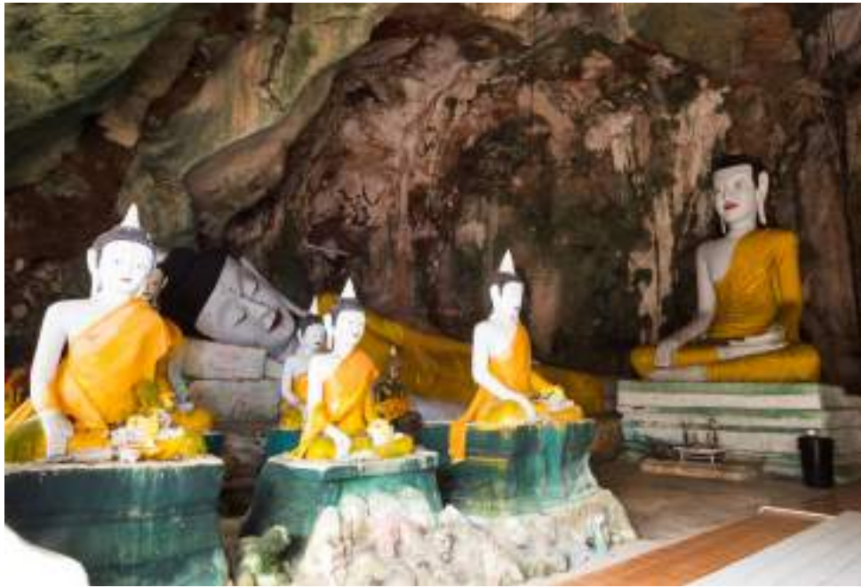
| La grotte de Wat Kuha Sawan