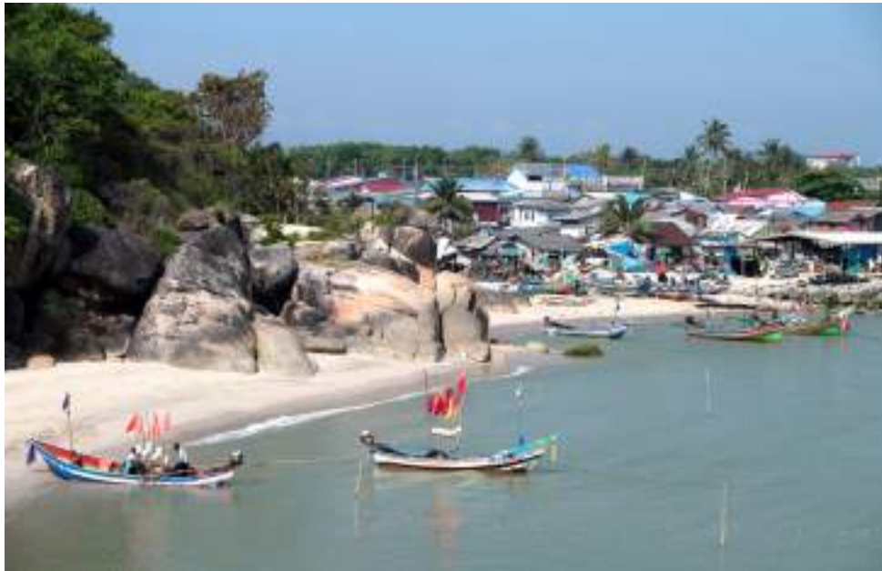
| La plage de Hat Kao Seng