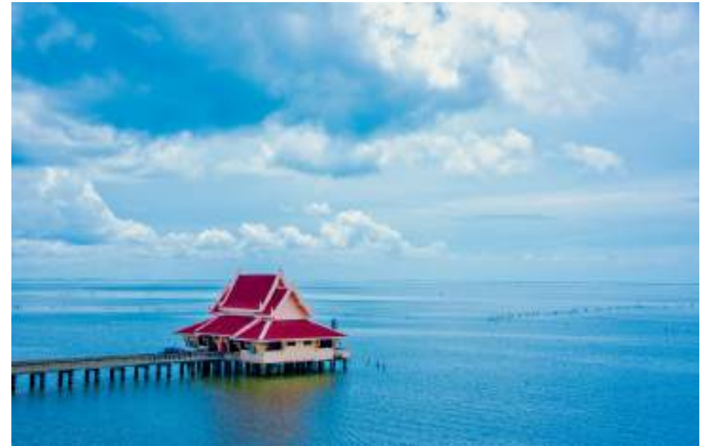
| La plage de Hat Saen Suk

Au 19e s, la résidence du gouverneur abritait à la fois la maison du seigneur de la ville et le siège du gouvernement local. Elle se compose de plusieurs bâtiments typiquement thaïlandais au plancher surélevé, combinant des styles architecturaux typiques du sud et du centre de la Thaïlande. Une visite à conseiller aux amateurs d'architecture, mais aussi d'histoire puisqu'elle regorge d'enseignements sur la lignée des gouverneurs de Phatthalung.