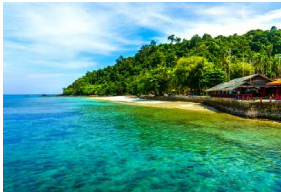
| L'île de Ko Ngai

Ko Ngai – « l'île de la jarre » en thaï - déploie sur sa côte une belle plage de 3 km aux eaux turquoise et transparentes, où se trouvent quelques hôtels et restaurants avec un beau panorama sur les îles et le littoral de Trang. Coiffée de sommets de karst et recouverte d'une dense forêt, Ko Ngai ne compte aucune habitation, hormis les infrastructures hôtelières. Possibilité de faire de la randonnée vers la façade ouest de l'île (Paradise Beach et Ao Mamuang), ainsi que du kayak, du snorkeling et de la plongée dans les îlots environnants de Ko Waen, Ko Chuak et Ko Mar. Excursions vers les îles voisines de Ko Muk et Ko Kradan à la journée. Ko Ngai est accessible en bateau depuis l'embarcadère de Pak Meng (1h).