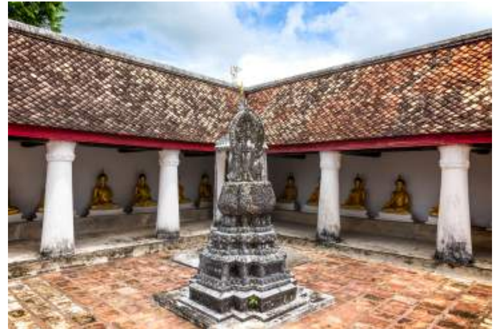
| Le temple Wat Wang

Sa salle de prières et d'ordination (ubosot), caractéristique de l'époque de Rattanakosin, est décorée de superbes fresques de l'époque de Rama IV, dont certaines sont attribuées aux artistes ayant décoré le Wat Phra Kaeo à Bangkok. Plus d'une centaine d'effigies du Bouddha en stuc décorent l'édifice qui émerveillera les passionnés d'architecture.